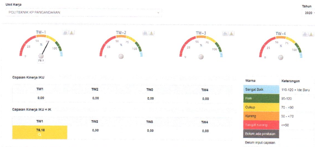
Gambar 3.2 Nilai pencapaian sasaran strategis (NPSS) Politeknik KP Pangandaran triwulan 1 Tahun 2020.

Hasil pengukuran capaian kinerja diatas terlihat nilai pencapaian sasaran strategis (NPSS) triwulan 1 Tahun 2020 tercapai sebesar 78,10%, yang berasal dari capaian kinerja masing-masing perspektif sebagai berikut: