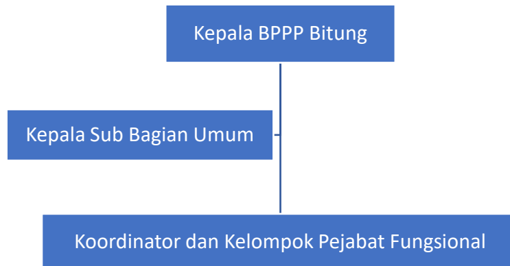
Gambar 1. Struktur Organisasi BPPP Bitung

Berdasarkan Peraturan Menteri Kelautan dan Perikanan Nomor PER.87/KEPMEN-KP/2020 tentang Organisasi dan Tata Kerja Balai Pelatihan dan Penyuluhan Perikanan Bitung, Struktur Organisasi di BPPP Bitung dapat dilihat pada Gambar 1.