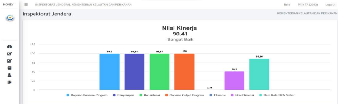
Gambar 4. Nilai Indikator Kinerja Nilai Kinerja Anggaran (NKA) Tahun 2023

Realisasi IKU Nilai Kinerja Anggaran (NKA) Itjen KKP Tahun 2023 sebesar 90,41 jika dibandingkan dengan target 2024 atau akhir perencanaan jangka menengah maka dengan hasil capaian sebesar 101,58 dari target 89 dan disajikan pada Tabel 23.