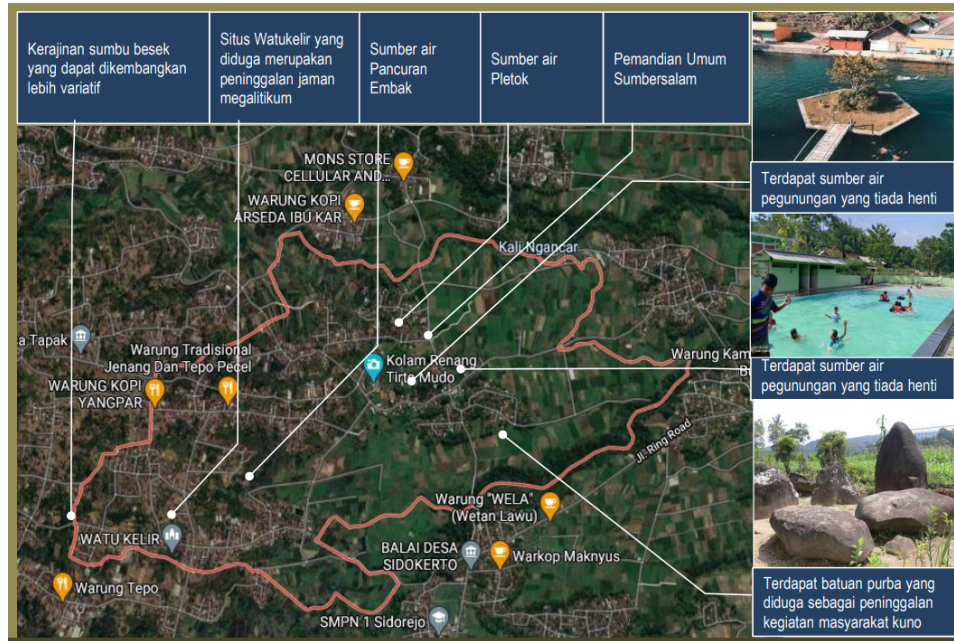
Gambar 3 Pemetaan Desa Sumberdodol Magetan

Pada Tahun 2024 ini, target IKU Desa mitra Politeknik KP Sidoarjo yang meningkat kompetensinya (Desa Perikanan Cerdas) sebesar 1 desa. Pengukuran capaian IKU ini direncanakan pada akhir tahun. Progres capaian IKU ini, telah dilaksanakan beberapa kegiatan Pelatihan Kepada Masyarakat yang melibatkan Penyuluh Perikanan. Adapun kegiatan pelatihan yang diadakan adalah sebagai berikut :