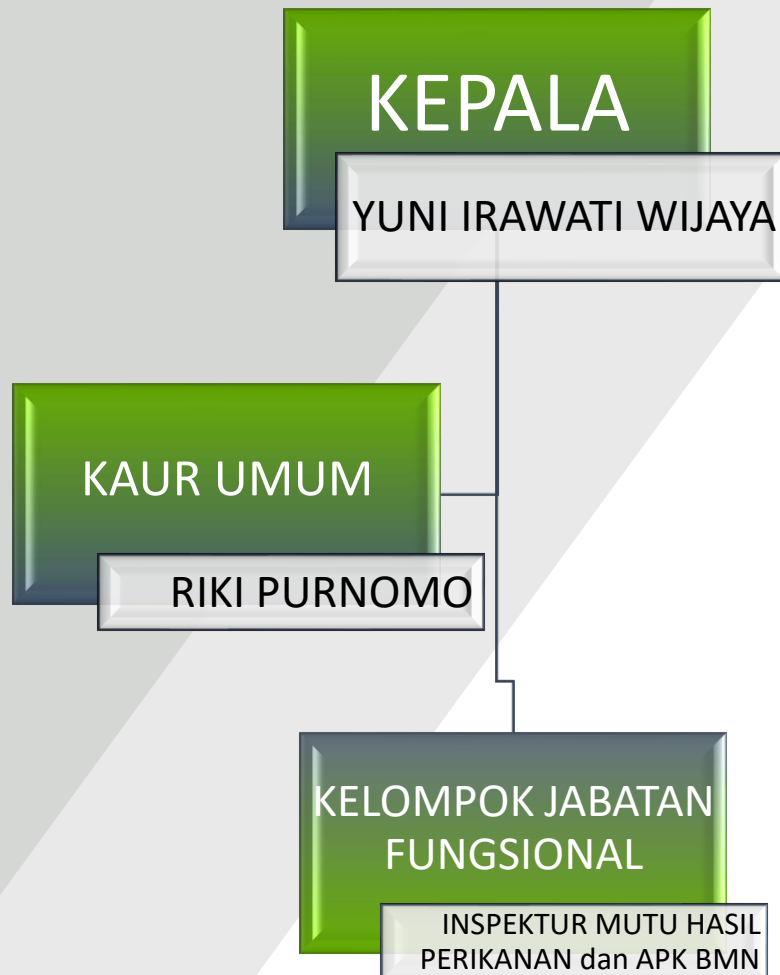
Gambar 1. Struktur Organisasi SKIPM Baubau 2024