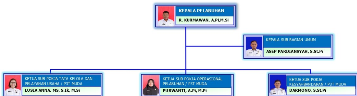
Gambar 2. Struktur Organisasi PPN Sungailiat Tahun 2023