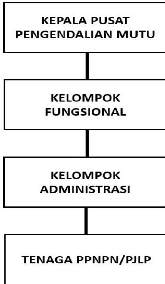
Gambar 1. Struktur Organisasi Pusat Pengendalian Mutu