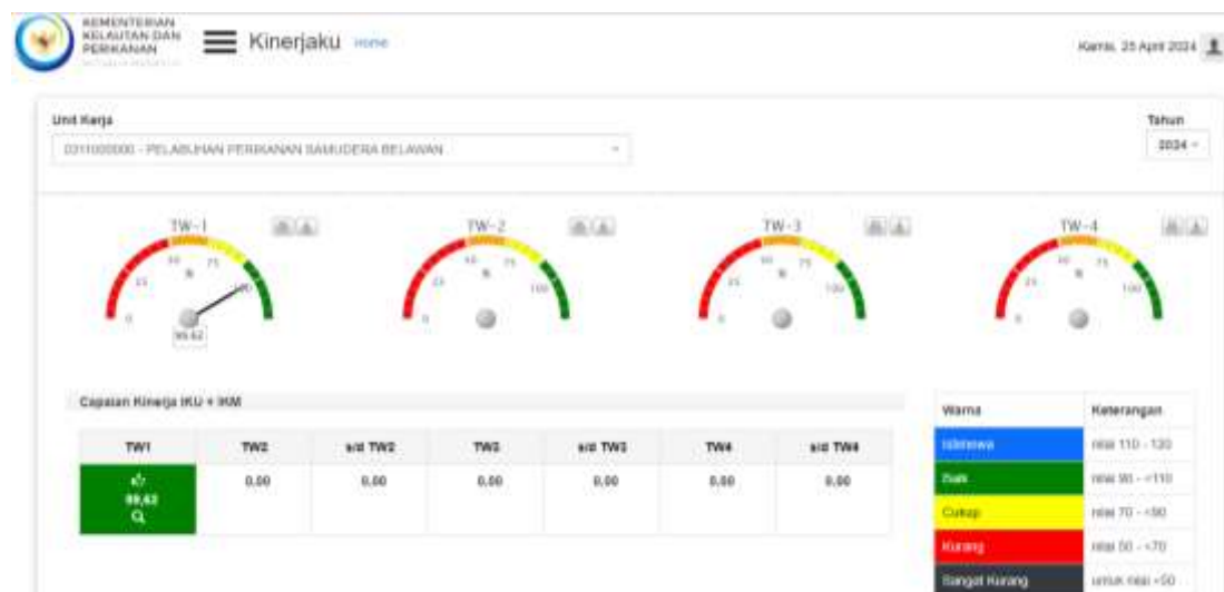
Gambar 3. Dashboard Kinerja PPS Belawan Triwulan I Tahun 2024 sebagaimana pada aplikasi http://Kinerjaku.kkp.go.id

Pada Triwulan I tahun 2024, PPS Belawan telah menetapkan 18 (Delapan belas) IK, dimana realisasi sampai dengan Triwulan I tahun 2024 menunjukkan bahwa sasaran kegiatan telah dapat dicapai dengan rata-rata capaian sebesar 113,75% (Istimewa) (Gambar2). Uraian rincian dari hasil pengukuran capaian kinerja dilaporkan pada bagian selanjutnya bab III.