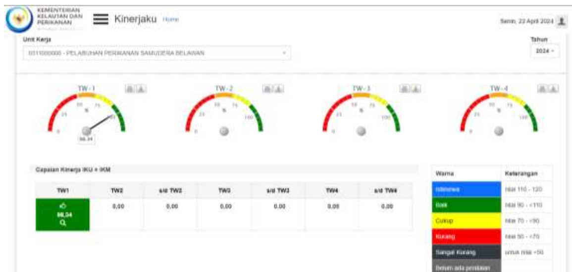
Gambar 1. Dashboard Capaian Nilai Kinerja Organisasi (NKO) PPS Belawan UPDATE TANGGAL 22/04/2024