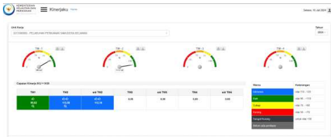
Gambar 3. Dashboard Kinerja PPS Belawan Triwulan II Tahun 2024 sebagaimana pada aplikasi http://Kinerjaku.kkp.go.id

Pada Triwulan II tahun 2024, PPS Belawan telah menetapkan 18 (Delapan belas) IK, dimana realisasi sampai dengan Triwulan II tahun 2024 menunjukkan bahwa sasaran kegiatan telah dapat dicapai dengan rata-rata capaian sebesar 113,75% (Istimewa) (Gambar2). Uraian rincian dari hasil pengukuran capaian kinerja dilaporkan pada bagian selanjutnya bab III.