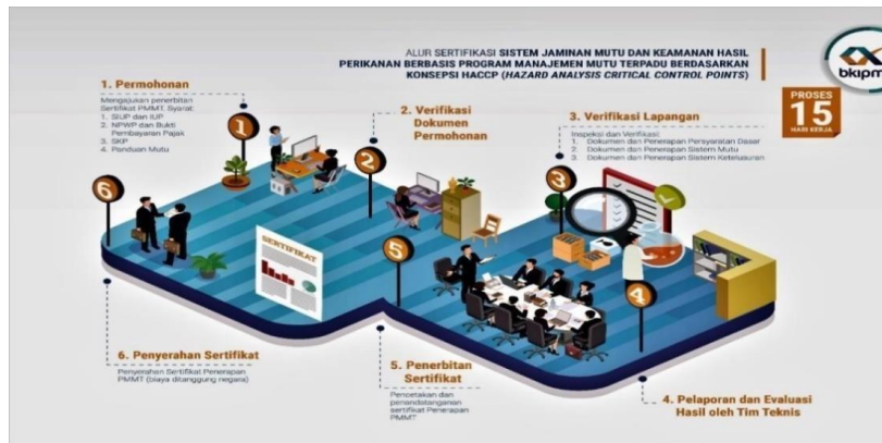
Gambar 3. Alur Sertifikasi Sistem Jaminan Mutu dan Keamanan Hasil

persyaratan produk perikanan yang aman dikonsumsi